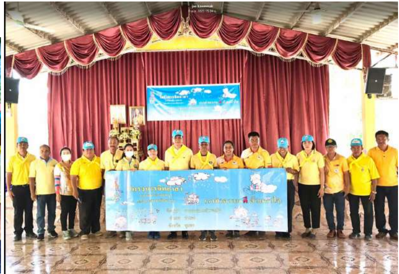
- ช่วยกันจัดตกแต่งสถานที่ต่างๆ เพื่อเตรียมการจัดงานโครงการของ อบต.คูริง